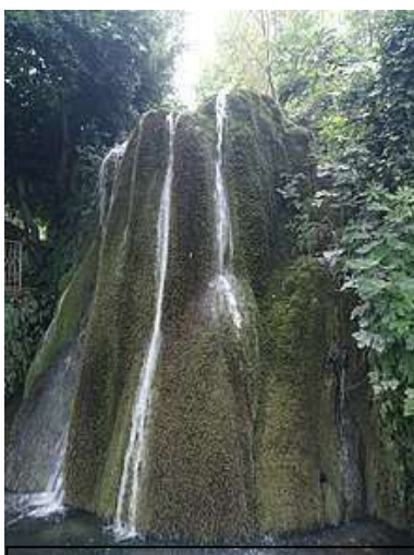
Sadali:- Cascata di San Valentino

cui sono presenti i resti di un'antica foresta secolare che prima ricopriva l'intero "tacco" e che oggi è presente solo lungo le valli che lo contornano. Le essenze arboree che costituiscono le foreste sono principalmente lecci, sughere, roverelle e sporadici esemplari di tasso, agrifoglio e acero, mentre il sottobosco è costituito da ginepro, corbezzolo, lentisco, fillirea, erica, rosmarino, cisto che nel loro insieme costituiscono la tipica macchia mediterranea.