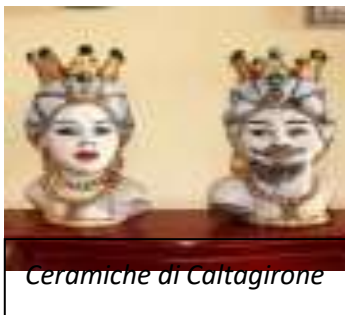
Ceramiche di Caltagirone

Caltagirone ( Caltagiruni in siciliano) è una delle