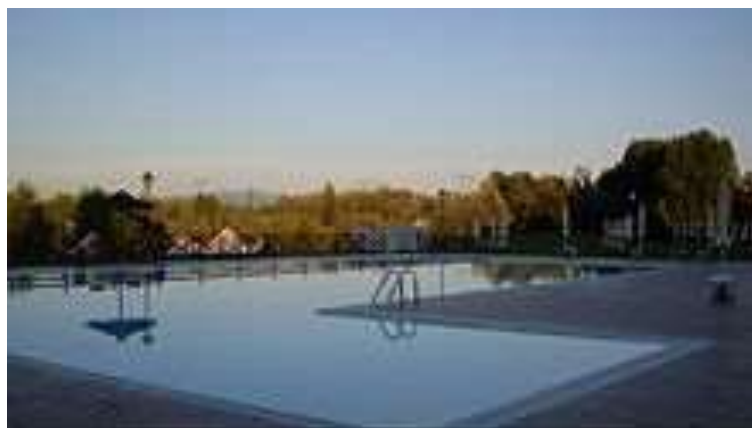
Foto: Vista della Piscina del Parco dei Renai

Tra Signa e Firenze si estende un'area di proprietà privata per 270 ettari il Parco dei Renai chiamato anche "Stato libero dei Renai" o "Isola dei Renai", area abbandonata in progressiva trasformazione a parco dalla fine dell'estate del 2000. Attualmente sono aperti al pubblico, da maggio ad ottobre, ad ingresso gratuito, 70 ettari, gestiti da una società per azioni pubblico-privata.