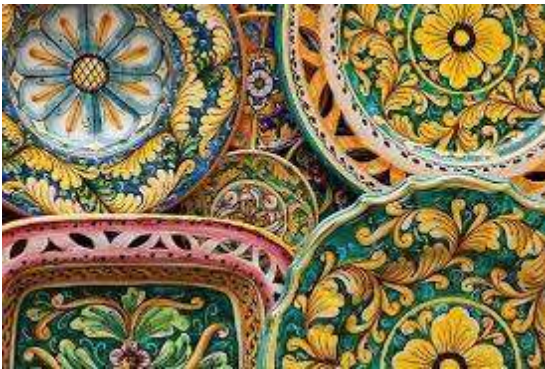
Santo Stefano di Camastra | Casa La Rocca

La stazione di Taormina-Giardini , ritenuta come la più elegante del mondo, è una delle principali stazioni della linea ferroviaria Messina-Siracusa.