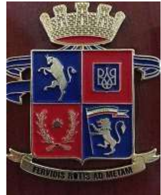
Stemma del Reggimento Genio Ferrovieri di Castelmaggiore