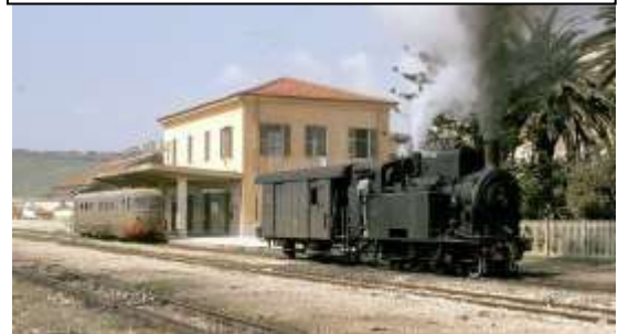
Stazione di Sciacca anni 70

testa per nove anni. Il 2 luglio 1923 venne aperta il tratto Sciacca-Ribera. Nel 1986 la stazione cessò il suo funzionamento insieme alla tratta Castelvetro-Sciacca. Da anni si discute di un suo possibile ripristino: la Legge 128/2017 include una porzione di 23 km della linea Castelvetro - Porto Empedocle tra le 18 ferrovie turistiche da salvaguardare; la stazione dovrebbe essere ricollegata a quella di Castelvetro permettendo l'instradamento verso le direzioni di Trapani e Palermo, collegando così la città con il capoluogo siciliano e quindi ai due aeroporti di Trapani-Birgi e Palermo-Punta Raisi Il Fabbricato Viaggiatori, vincolato dalla Soprintendenza ai Beni Culturali di Agrigento, risulta venduto a privati ed è interessato da lavori di ristrutturazione. è una delle 44 città della Ceramica ( città italiana di "affermata tradizione ceramica", riconosciuta dal MISE – Ministero dello Sviluppo Economico ).