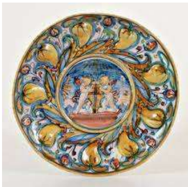
Ceramica di Gubbio (Umbria) - Coppa Sperindio della Bottega di Mastro Giorgio Andreoli - inizi del XVI secolo - Ceramica, Ceramiche decorative, Maiolica

Inoltre, Gubbio è nota nel mondo per la Festa dei Ceri (15 maggio) e il Palio della Balestra (ultima domenica di Maggio) nonché il Festival del Medioevo (Settembre).