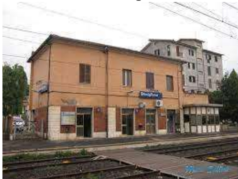
Stazione di Stimigliano (lato binari)

(a 5 Km dalla Stazione) del Santuario di Vescovio la Chiesa di Santa Marina (Comune di Torri in Sabina) che si trova a Vescovio in Sabina, è il trionfo della bellezza e della pace. Non a caso, è considerato come uno dei più celebri ed illustri monumenti che si possono ammirare in tutto l'antico territorio abitato dai Sabini.