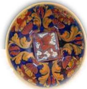
Ceramica a Lustro di Gualdo Tadino