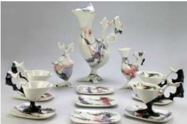
Museo Internazionale del Design Ceramico a Cerro di Laveno - Lago Maggiore

Laveno è una delle 44 città della Ceramica (città italiana di “affermata tradizione ceramica”, riconosciuta dal MISE – Ministero dello Sviluppo Economico)