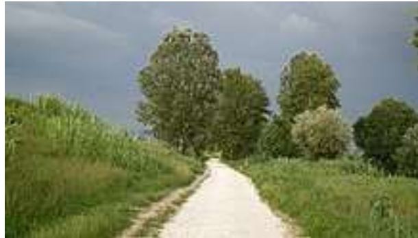
Foto: La pista ciclabile che collega il Parco dei Renai con il Parco delle Cascine a Firenze

gli anni sessanta e settanta. Nel 1990 iniziarono le trattative tra i privati ed il comune per il recupero dell'area con una prima ipotesi di piano di recupero dell'area, il cosiddetto "Progetto Michelucci", il quale prevedeva la riqualificazione del territorio attraverso la costruzione di impianti sia sportivi sia ricreativi e la salvaguardia di alcune zone faunistiche, la riserva integrale WWF, ove tutt'oggi sono presenti animali considerati in via di estinzione.