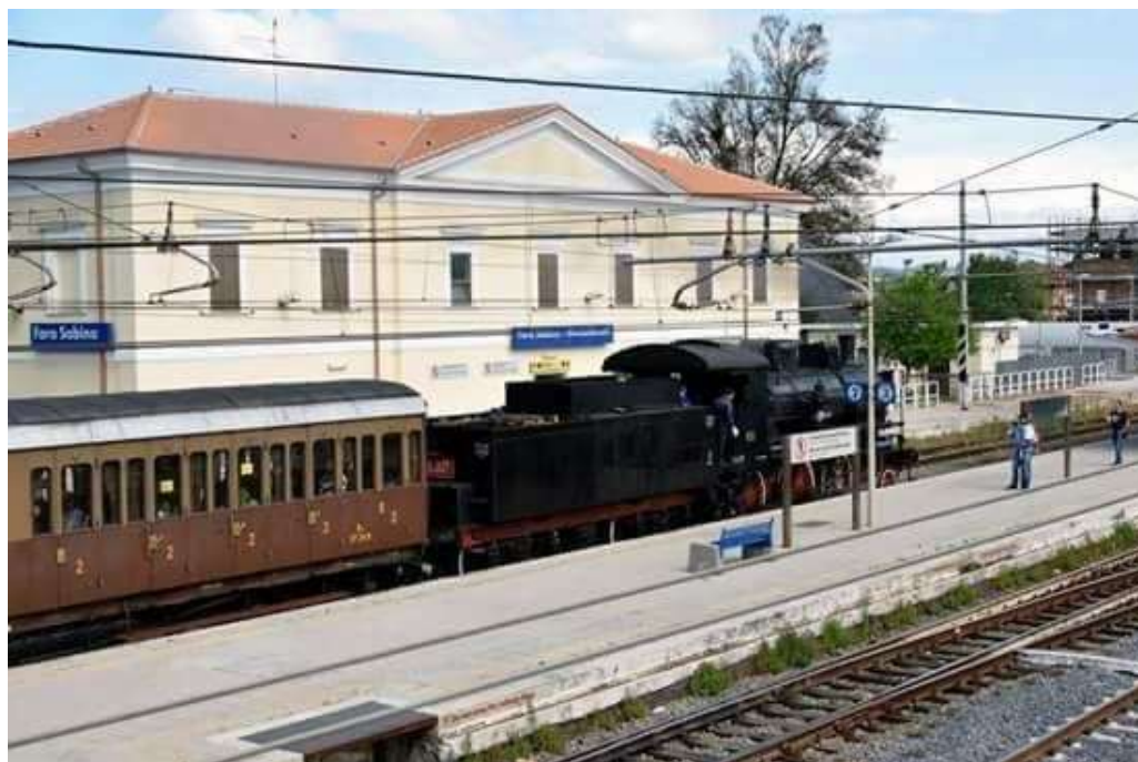
Foto: Stazione di Fara in Sabina Passaggio Treno Storico.