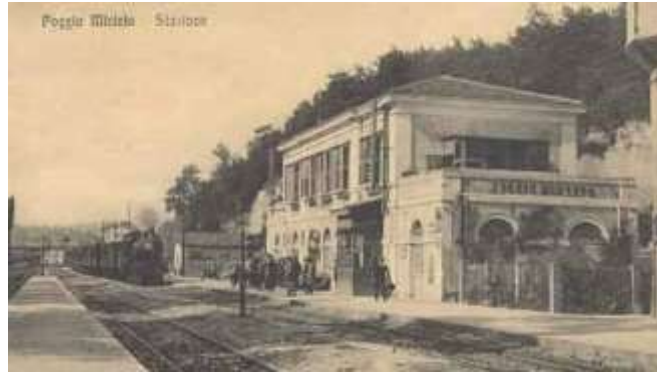
Foto antica della Stazione di Poggio Mirteto (Rieti) Linea Roma - Orte

Poggio Mirteto è sede della diocesi suburbicaria di Sabina-Poggio Mirteto, oltre che di scuole di diverso ordine e grado e di numerosi servizi.