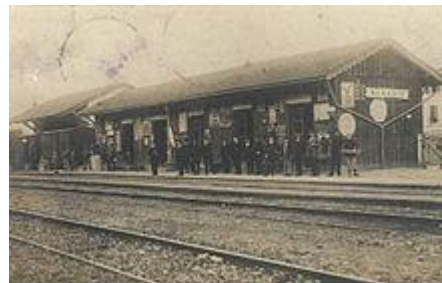
9 - Alassio, prima stazione in legno

La stazione di Alassio è una stazione ferroviaria a servizio del comune di Alassio sulla linea Genova-Ventimiglia. La prima stazione di Alassio fu realizzata, in legno, nel 1872 da parte della Società per le Ferrovie dell'Alta Italia diventa poi Rete Mediterranea. Nel 1888 fu invece realizzato il Magazzino merci.