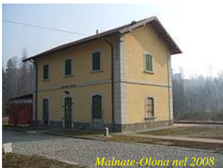
Malnate-Olona nel 2008

Nel 1888, la stazione, assieme alle due linee, passò sotto la gestione delle Ferrovie Nord Milano. Tra il 1926 e il 1927, la stazione divenne l'impianto presso il quale avviene il passaggio fra l'esercizio in singolo binario e quello in doppio binario della Saronno-Laveno. Nel 1966 fu soppresso il traffico sulla Varese-Como. Con il disarmamento della linea per Grandate, la stazione di Malnate rimase quindi attiva solo per la Saronno-Laveno.