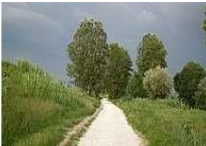
Foto: La pista ciclabile che collega il Parco dei Renai con il Parco delle Cascine a Firenze

il posto a un'incontrollata escavazione di inerti o rena, da cui il termine "Renai", specie tra gli anni sessanta e settanta. Nel 1990 iniziarono le trattative tra i privati ed il comune per il recupero dell'area con una prima ipotesi di piano di recupero dell'area, il cosiddetto "Progetto Michelucci", il quale prevedeva la riqualificazione del territorio attraverso la costruzione di impianti sia sportivi sia ricreativi e la salvaguardia di alcune zone faunistiche, la riserva integrale WWF, ove tutt'oggi sono presenti animali considerati in via di estinzione.