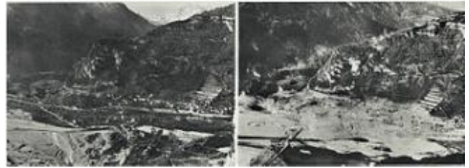
5 - Longarone prima e dopo il disastro del Vajont

Il 9 ottobre 1963 alle ore 22:39 il paese fu colpito dal disastro del Vajont, una strage causata da una frana staccatasi dal monte Toc, di fronte a Erto e Casso, e precipitata nel bacino artificiale creato dalla diga del Vajont, provocando un'onda che scavalcò la diga e travolse il paese sottostante, distruggendolo e provocando 1.917 morti di cui 1.458 solo a Longarone.