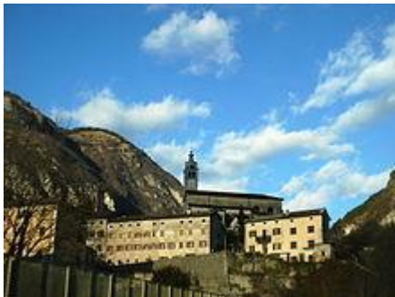
4 - La Rocca di Castellavazzo

Durante la prima guerra mondiale Longarone fu sede di una nota battaglia il 9 novembre 1917 in cui fu protagonista l'allora giovane tenente Erwin Rommel. Nel dicembre 1959 la cittadina diede vita alla prima Fiera del Gelato: Longarone è la sede della Mostra Internazionale del Gelato Artigianale (MIG). Questo anche grazie alla tradizione ultracentenaria delle storiche famiglie di gelatieri che, dai comuni delle valli limitrofe di Zoldo Alto, Forno di Zoldo e Zoppè di Cadore, hanno contribuito in maniera determinante a far conoscere il gelato artigianale tradizionale italiano in Italia, Germania, Austria, Paesi Bassi e nel mondo intero.