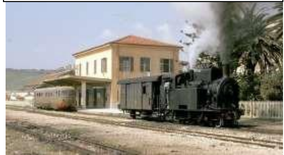
Stazione di Sciacca anni 70

Sciacca è un comune italiano di 39.066 abitanti del libero consorzio comunale di Agrigento in Sicilia. Città marinara, turistica e termale, ricca di monumenti e chiese, è il comune più popoloso della provincia dopo il capoluogo. È nota per il suo storico carnevale e per la ceramica. Gli arabi conquistarono la città nell'840. Ne influenzarono il tessuto urbanistico e la toponomastica (il quartiere San Nicolò, anticamente chiamato Rabato, Schiunchipani, Cartabubbo, Misilifurmi e Raganella) e diedero impulso all'industria del cotone.