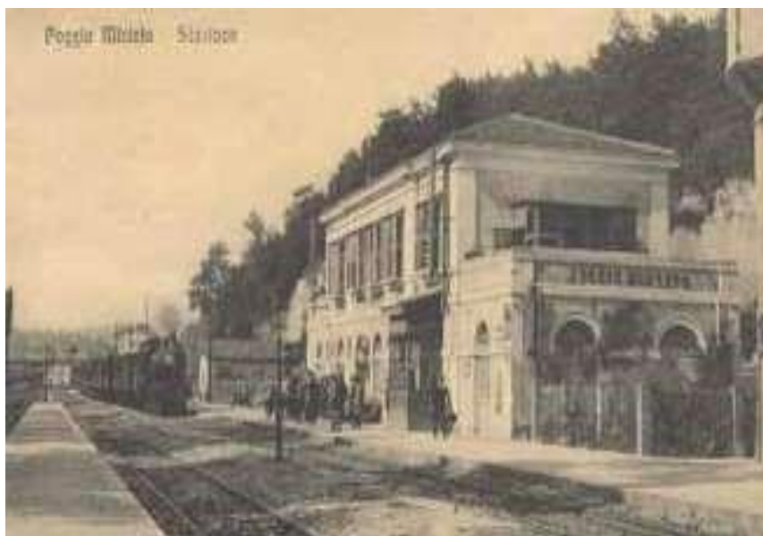
Foto antica della Stazione di Poggio Mirteto (Rieti) Linea Roma - Orte