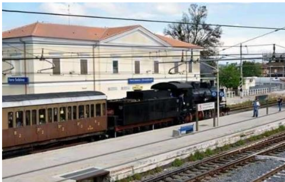
Foto: Stazione di Fara in Sabina Passaggio Treno Storico.