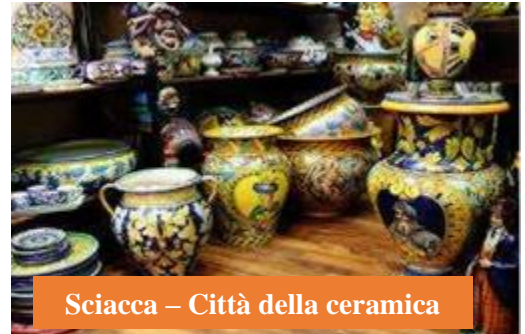
Sciacca – Città della ceramica

Nel 1355, la città passò in mano ai Peralta. A Sciacca fu istituita la carica di Capitano di guerra per la difesa della città. Tale compito fu affidato a Guglielmo Peraltache, oltre ad essere conte di Caltabellotta, poiché era apparentato col re, possedeva vasti territori avuti in eredità, per occupazione o per concessione regia. Dal re aveva ottenuto la rappresentanza della Magna Curia, cioè l'istituzione di una suprema autorità con funzioni giudiziarie inappellabili.