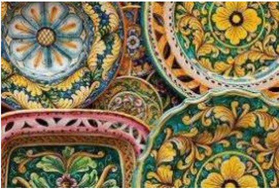
Santo Stefano di Camastra | Casa La Rocca

La stazione di Taormina-Giardini , ritenuta come la più elegante del mondo, è una delle principali stazioni della linea ferroviaria Messina-Siracusa.