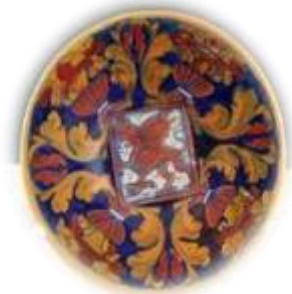
Ceramica a Lustro di Gualdo Tadino

della Ceramica (città italiana di “ affermata tradizione ceramica ”, riconosciuta dal MISE – Ministero dello Sviluppo Economico). Quest'arte antica segna l'identità economica e artistica della città. Alla ceramica era legata la manifestazione del Concorso Internazionale della Ceramica, che vedeva ogni anno la presenza di artisti di oltre 20 paesi del mondo ed ha consentito di acquisire nel tempo un patrimonio di oltre 100 opere, che rappresentano uno spaccato rilevante della moderna ricerca artistica nel settore.