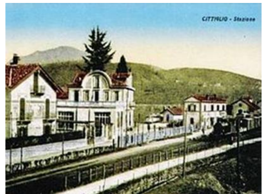
1 - Foto d'Epoca Stazione di Cittiglio

La Stazione di Cittiglio , classificata come stazione secondaria, è gestita da Ferrovienord. Il piazzale del ferro è costituito da due binari, provvisti di banchina e di sottopassaggio. La circolazione è gestita in telecomando dal dirigente centrale operativo da Varese Nord.