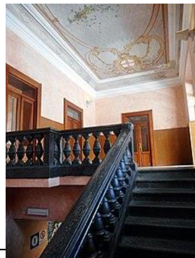
11 - Interno stazione