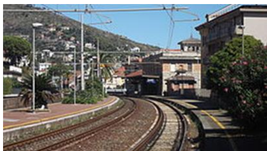
10 - Piazzale della stazione

La stazione è abilitata al movimento ed era telecomandata da Albenga. Il 18 gennaio 2016 è stato attivato il nuovo impianto ACC (Apparato Centrale Computerizzato) con posto di comando remotizzato posto ad Albenga. In futuro è previsto il controllo diretto dalla sala operativa di Genova Teglià,