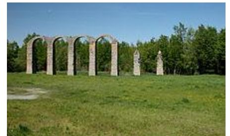
7 - Resti acquedotto romano

Un monumentale acquedotto, inoltre, garantiva l'approvvigionamento di acqua comune sia per gli usi termali che per quelli domestici e produttivi.