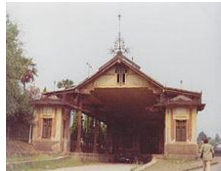
8 - Stazione ferroviaria degli anni Sessanta

Stresa è uno dei porti di attracco dei battelli turistici della navigazione del Lago Maggiore. Vi è inoltre la sede della Capitaneria di Portodel Lago Maggiore.