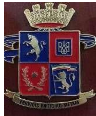
Stemma del Reggimento Genio Ferrovieri di Castelmaggiore

di vasti e belli parchi pubblici urbani;