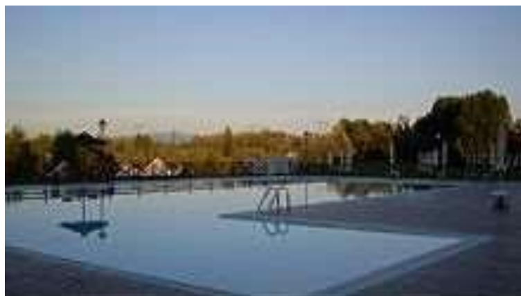
Foto: Vista della Piscina del Parco dei Renai

Tra Signa e Firenze si estende un'area di proprietà privata per 270 ettari il Parco dei Renai chiamato anche "Stato libero dei Renai" o "Isola dei Renai", area abbandonata in progressiva trasformazione a parco dalla fine dell'estate del 2000. Attualmente sono aperti al pubblico, da maggio ad ottobre, ad ingresso gratuito, 70 ettari, gestiti da una società per azioni pubblico-privata.