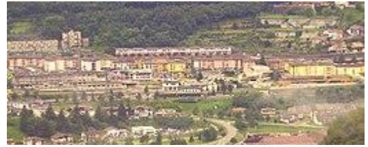
3 - Panorama del 2008 con la stazione al centro

La stazione originaria venne distrutta, insieme a circa due chilometri di ferrovia, in seguito al disastro del Vajont del 9 ottobre 1963; dopo i necessari lavori di ricostruzione, venne riaperta al traffico la sera del 30 maggio dell'anno successivo, in tempo per l'orario estivo entrato in vigore il giorno seguente.