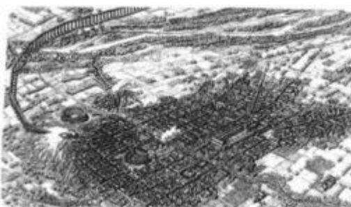
6- Antica carta topografica

Acqui Terme è un comune italiano di 18.966 abitanti della provincia di Alessandria in Piemonte. Si trova nella media-bassa valle del fiume Bormida, nell'alto Monferrato, ed è parte della regione geografica dell'Acquese. È, inoltre, uno dei centri-zona della Provincia di Alessandria in quanto sede dell'ospedale, del polo scolastico superiore e di altri servizi per i cittadini.