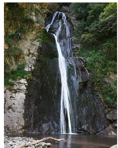
2 - La seconda delle tre cascate di Cittiglio, durante il periodo estivo

Cascate di Cittiglio: si tratta di tre salti d'acqua formati dal torrente San Giulio lungo le pendici boschive del Sasso del Ferro, alle spalle dell'abitato. Le cascate si trovano ad altezze comprese tra i 324 e i 474 m s.l.m. e sono raggiungibili con un sentiero che parte dal nucleo antico del paese.