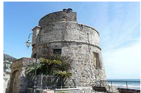
12 - Il "Torrione Saraceno" o "della Coscia".

Nel territorio alassino sono presenti due torri d'avvistamento, tra cui il più celebre è il "Torrione Saraceno" o "Torrione della Coscia". Costruito dalla Repubblica di Genova nel XVI secolo adiacente al mare nel Borgo Coscia, fu eretto principalmente per la difesa della costa dalle eventuali e frequenti incursioni dei pirati. Di origine molto più antica è la Torre di Vegliasco dove il primo proprietario fu Aleramo del Monferrato. Raffigurata nello stemma cittadino, si presenta a forma conica, la cui sommità è abbellita da una corona di caditoie.