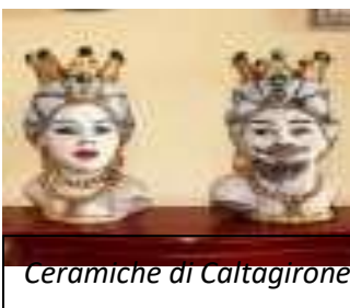
Ceramiche di Caltagirone

Caltagirone ( Caltaggiruni in siciliano) è una delle 44 città della Ceramica ( città italiana di