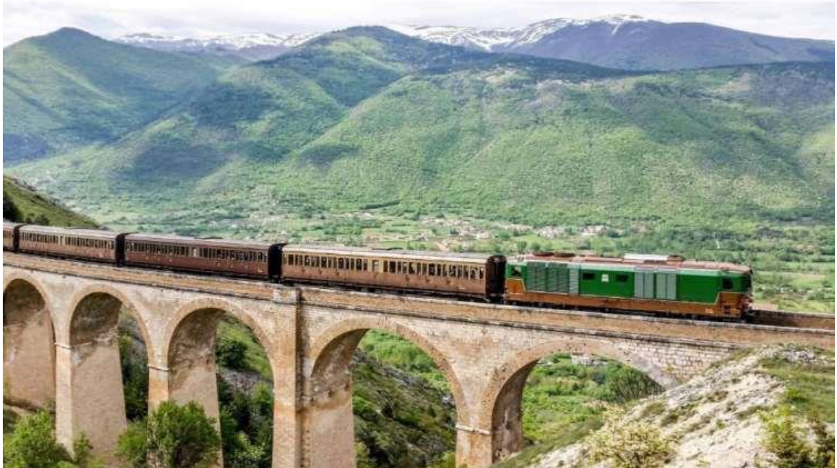
URBINO – Linea Ferroviaria