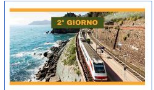
Venerdì 31 maggio

In mattinata escursione lungo la pista ciclabile ricavata dal sedime della linea ferroviaria arretrata in galleria nel 2001 (bici, bicicli e quadricicli sono noleggiabili in loco). Tarda mattinata trasferimento a Nizza (11.45 – 13.41 o corsa successiva) per incontro con l'associazione francese (Roya Expansion Nature) che sostiene il rilancio della ferrovia di Tenda e per un'escursione sulla rete tranviaria della città.